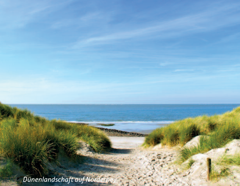
Dünenlandschaft auf Norderney